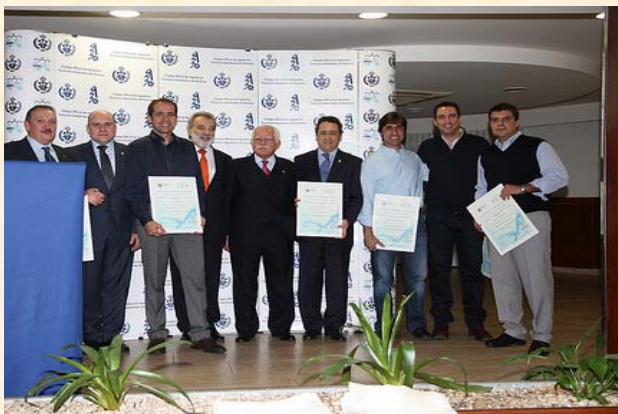
Alumnos del Curso de Mediación con los Decanos Gallegos

A lo largo de la misma, se hizo entrega de los diplomas a los colegiados que superaron con éxito el Curso de Mediación así como de las distintas Acreditaciones de Desarrollo Profesional Continuo.